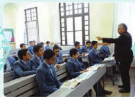
۱- انگشت، تبلی

اِبْتَغِدُوا عَنِ الْكَسَلِ؛ اِسْتَعْدِمُوا قُوَّتَكُمْ؛ تَعَلَّمُوا دُرُوسَكُمْ؛ لَاتَنْسَجِبُوا عَنِ اِدَاءِ وَاِجِبَتِكُمْ.