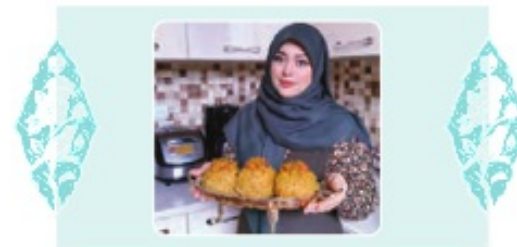
۱- أَكْمِلْ: كَاسِلٌ كُنْ ۲- اسْتَمِعُوا: كُوش فِرا دِهید