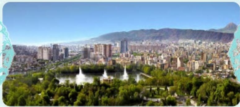
الجانب الشرقي من بستان إله غولي في مدينة تبريز.

اُكْتُبْ آيَةً أَوْ حَدِيثاً أَوْ نَصّاً بِاللُّغَةِ الْعَرَبِيَّةِ حَوْلَ مَسْئُولِيَّةِ جَمِيعِ الْمُواطِنِينَ بِالنِّسْبَةِ لِتُرُوتِ الْوَطَنِ وَ الْمَرَاقِي الْعَامَّةِ وَ الْآثَارِ التَّارِيخِيَّةِ وَ اَلْكُتُبِ تَرْجَمَتَهَا الْفَارِسِيَّةِ وَ الْإِنْجِلِيزِيَّةِ مُسْتَعِيناً بِمُعْجَمٍ.