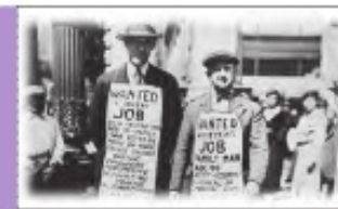
تصویری از بیکاران در رکود بزرگ دهه ۱۹۳۰ میلادی در اروپا

وجود این منابع بیکار سبب می‌شود که کشور در زیر مرز امکانات تولید قرار گیرد (نقطه X در شکل روبه‌رو). دلایل مختلفی برای قرار گرفتن در درون مرز امکانات تولید به جای قرار گرفتن روی آن وجود دارد. شاید برخی از کارخانه‌ها بسته شده‌اند یا بعضی از کارگرها بیکار هستند. وقتی یک اقتصاد منابع غیرفعال دارد، می‌تواند با استفاده از آن منابع غیرفعال کالا و خدمات زیادی تولید کند.