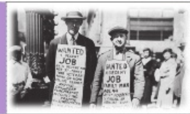
تصویری از بیکاران در رکود بزرگ دهه ۱۹۳۰ میلادی در اروپا

با کاهش تولید و پدید آمدن رکود، کارگران کمتری هم مورد نیاز است و سرمایه کمتری مورد استفاده قرار می‌گیرد؛ در چنین شرایطی اقتصاد دارای منابع بیکاری است که این منابع می‌توانست برای تولید کالا و خدمات از آن استفاده شود اما از آنها برای تولید هیچ چیز استفاده نمی‌شود!