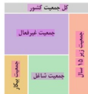
نمودار مفهومی جمعیت از حیث اشتغال و بیکاری

اگر تعداد افراد شاغل و بیکار را با هم جمع کنیم، جمعیت فعال جامعه به دست می‌آید. جمعیت فعال افرادی هستند که با مشغول به کارند یا دنبال کار می‌گردند. افراد دیگری را که در سن کار (بالای ۱۵ سال) قرار دارند ولی شاغل و یا بیکار نیستند، در جمعیت غیرفعال دسته‌بندی می‌کنند (مانند دانشجویان و دانش‌آموزان بالای ۱۵ سال).